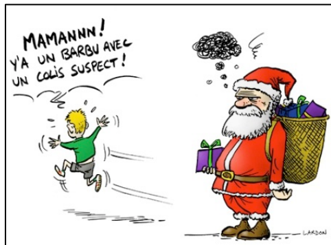
dessin copié de brisonslemythe.canalblog.com dessin de LARDON ( lardon.wordpress.com )