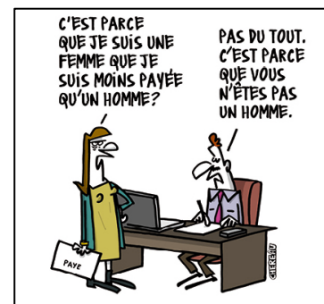
dessin copié de www.blog-emploi.com/ dessin de CHEREAU ( www.antoinechereau.fr )

L'enjeu pour la CGT est d'interpeller patronat et gouvernement sur la question des violences sexistes et sexuelles au travail et sur la protection du droit au travail des femmes victimes de violences conjugales et de gagner une ratification par la France de la norme OIT votée en juin dernier.