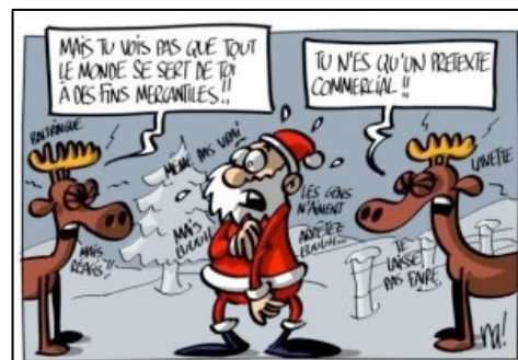
dessin copié de www.agoravox.fr dessin de na ( www.dessinateur.biz/ )

Le service social n'est pas "les bonnes œuvres" du président Bahi. C'est la directrice du SCASC qui doit inviter ses collègues car elle a la charge, avec un conseil paritaire, de la politique sociale de l'établissement (dans la limite des "pauvres" moyens alloués par le CA de l'UFC).